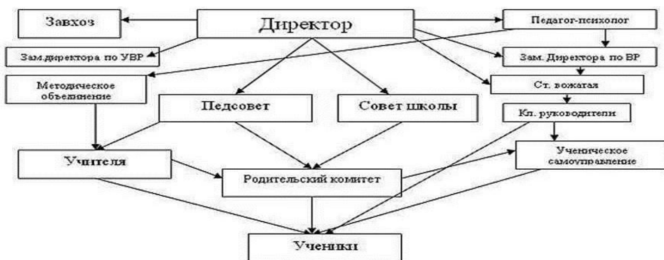
Схема системы управления МКОУ «СОШ им. А.Ж. Панагова с.п. Инаркой»

Структурное подразделение дошкольного образования не является юридическим лицом и осуществляет свою деятельность на основании Устава учреждения и Положения о структурном подразделении МКОУ «СОШ им. А.Ж. Панагова с.п. Инаркой», утверждённого приказом директора школы.